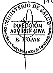
PROCESOS DEL PLAN ANUAL DE CONTRATACIONES 2019 DE LA DIRIS LIMA NORTE

ARTÍCULO PRIMERO. - APROBAR el Plan Anual de Contrataciones de la Unidad Ejecutora 144-1684 Dirección de Redes Integradas de Salud Lima Norte, con los procedimientos de selección que se señalan en el siguiente cuadro: